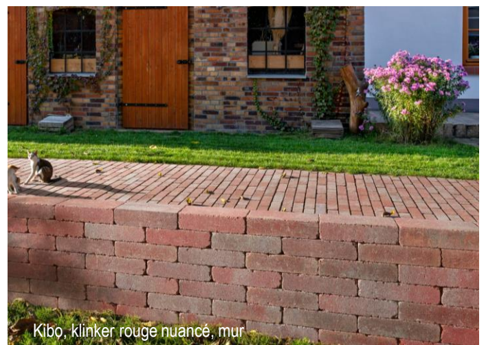
Kibo, klinker rouge nuancé, mur