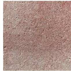
Klinker rouge nuancé

Autres revêtements et teintes disponibles sur demande