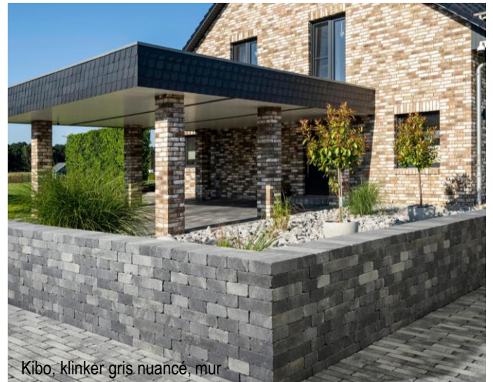
Kibo, klinker gris nuancé, mur