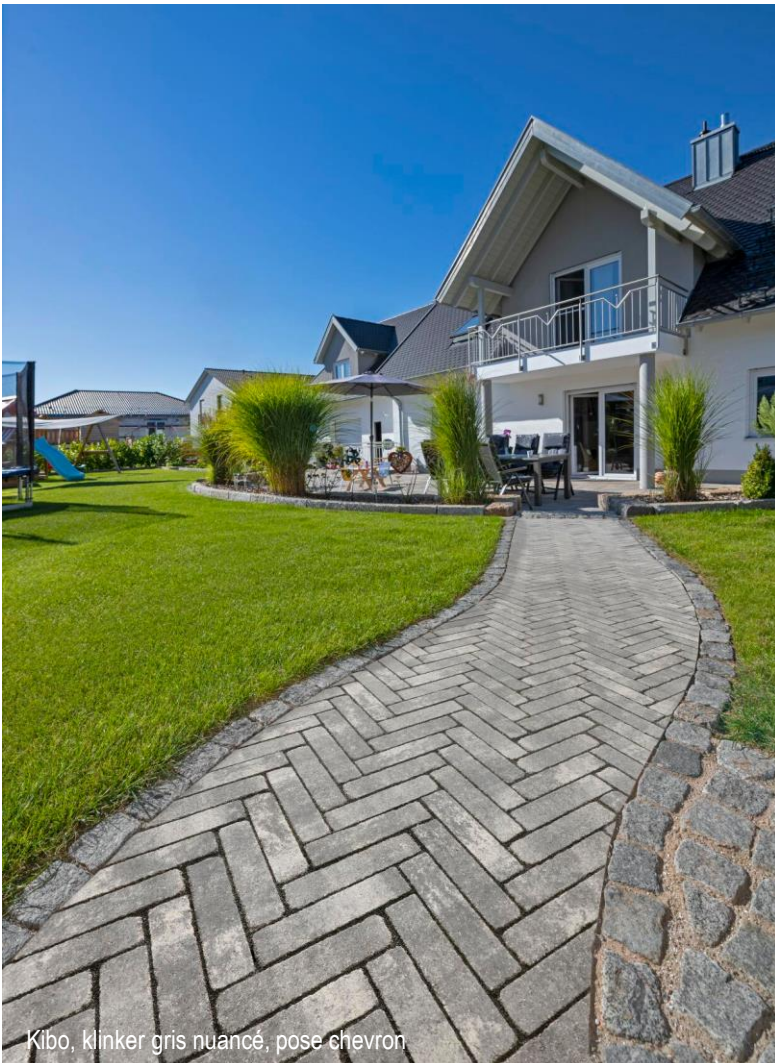
Kibo, klinker gris nuancé, pose chevron