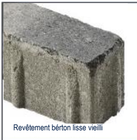
Revêtement béton lisse vieilli