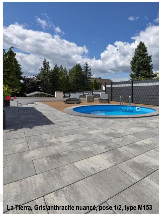
La Tierra, Gris/anthracite nuancé, pose 1/2, type M153