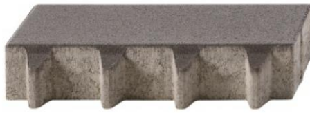
Béton lisse, joint 25 mm, arêtes chanfreinées R5/2 mm