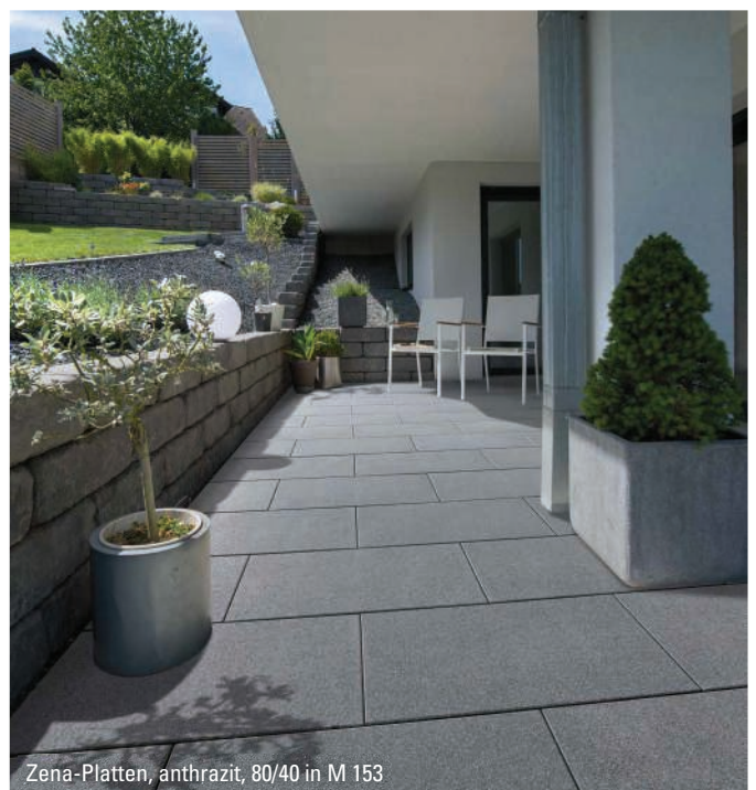
Zena-Platten, anthrazit, 80/40 in M 153