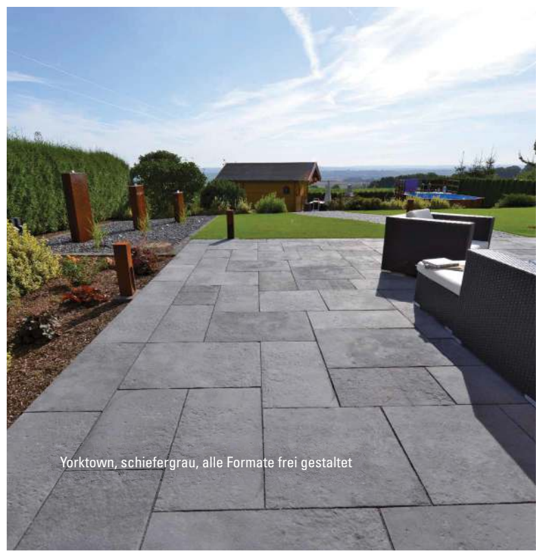
Yorktown, schiefergrau, alle Formate frei gestaltet