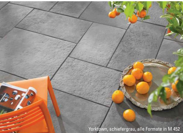
Yorktown, schiefergrau, alle Formate in M 452