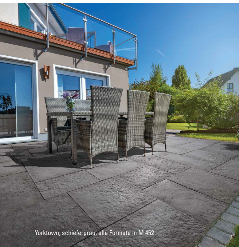
Yorktown, schiefergrau, alle Formate in M 452