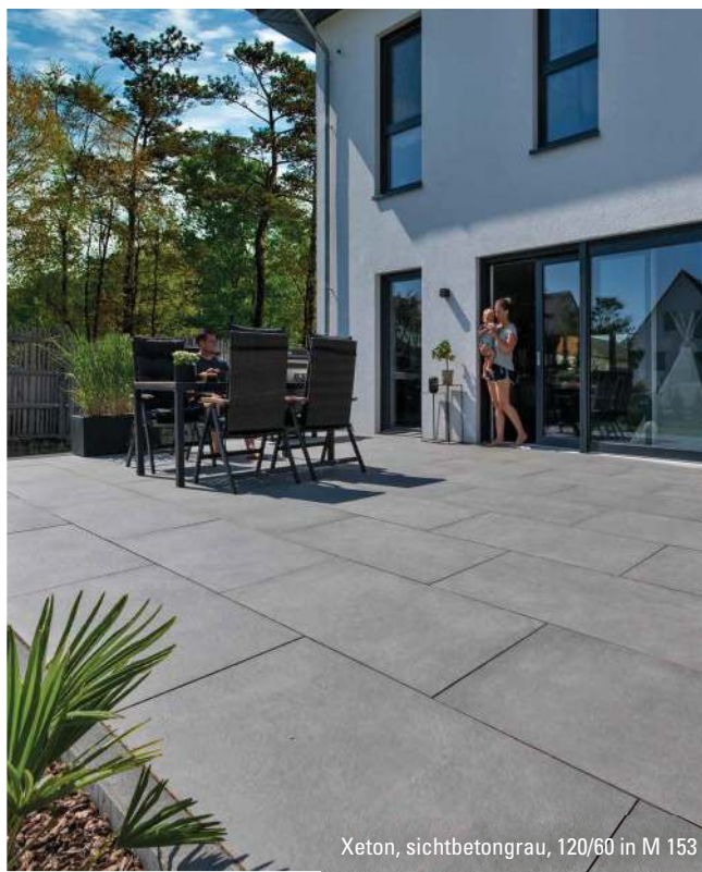
Xeton, sichtbetongrau, 120/60 in M 153