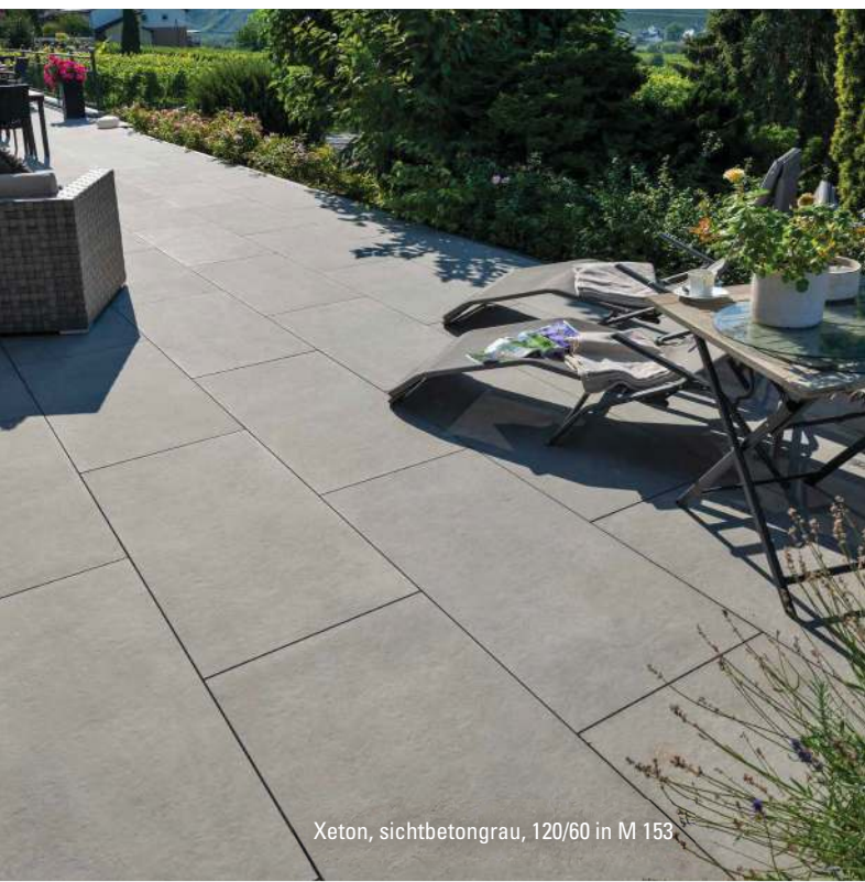
Xeton, sichtbetongrau, 120/60 in M 153