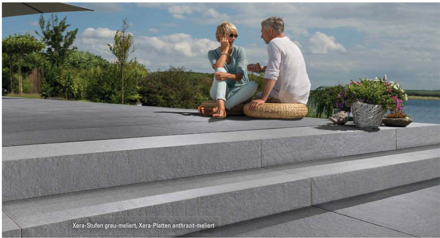
Xera-Stufen grau-meliert, Xera-Platten anthrazit-meliert