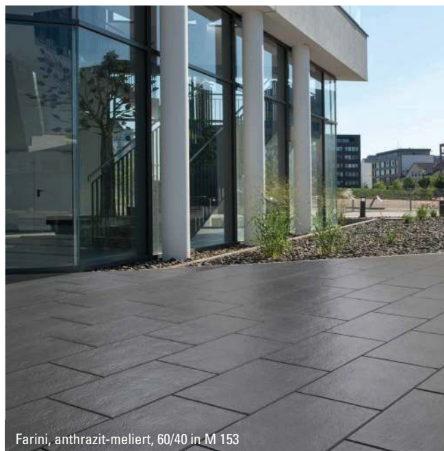
Farini, anthrazit-meliert, 60/40 in M 153