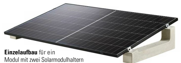
Einzelaufbau für ein Modul mit zwei Solarmodulhaltern