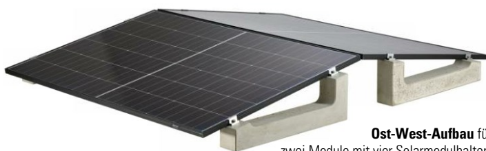
Ost-West-Aufbau für zwei Module mit vier Solarmodulhaltern