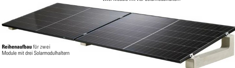
Reihenaufbau für zwei Module mit drei Solarmodulhaltern