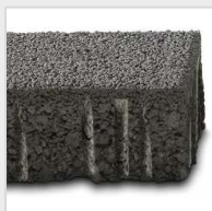
Pavé poreux, chanfrein R5/2 mm