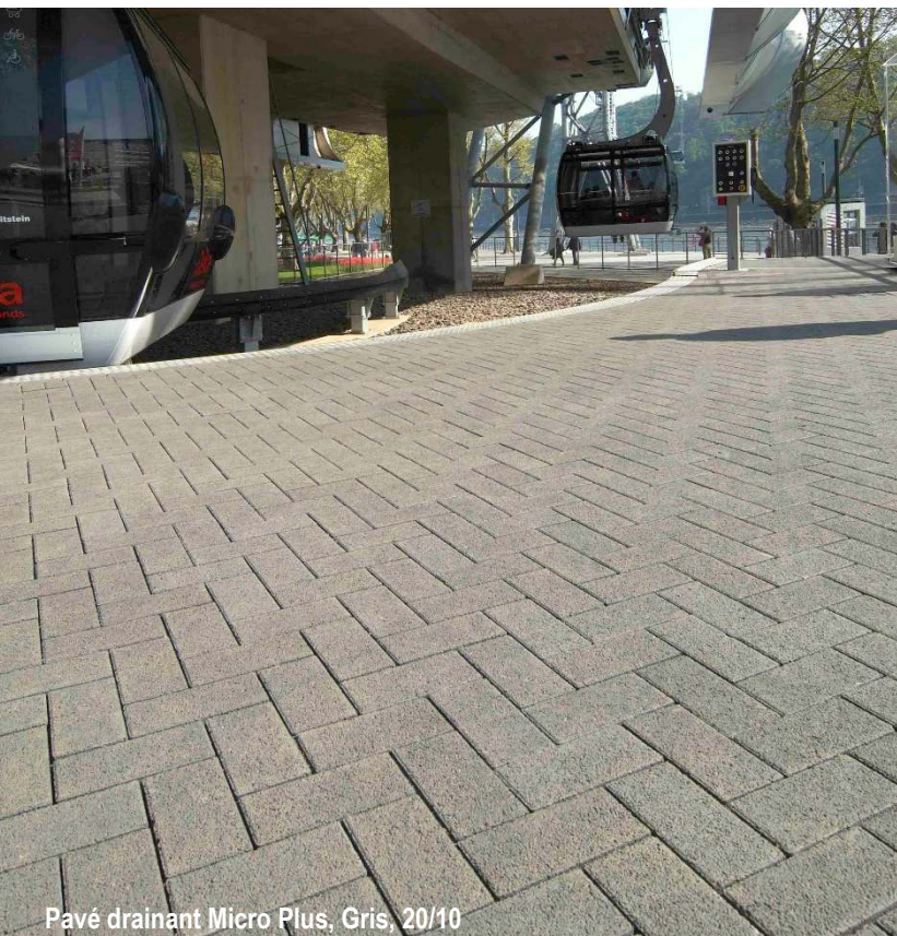
Pavé drainant Micro Plus, Gris, 20/10