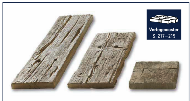
Verlegemuster S. 217–219