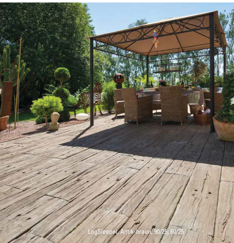
LogSleeper, Antik-braun, 90/25; 60/25

1) Eisenbahnschwellenoptik 2) Hirnholzoptik