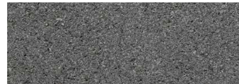
granitgrau, geschliffen + gestrahlt